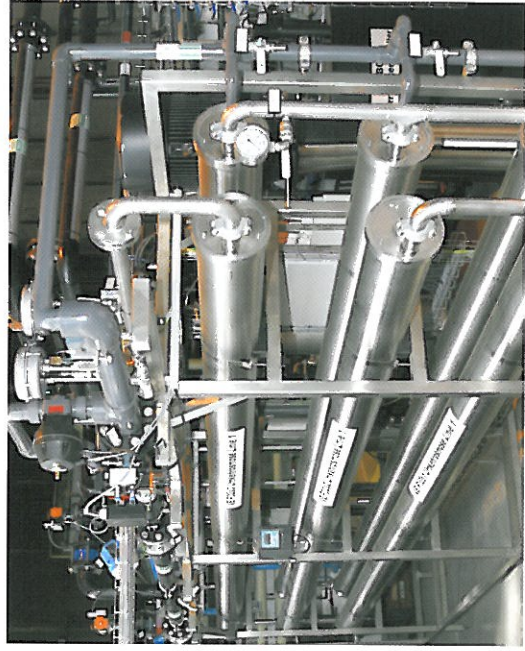
ThyssenKrupp Steel AG, Bochum

Als 100%iges Tochterunternehmen der GELSENWASSERAG verfügt AWS über die organisatorischen und finanziellen Voraussetzungen, um auch komplexe Projekte souverän zu verwirklichen.