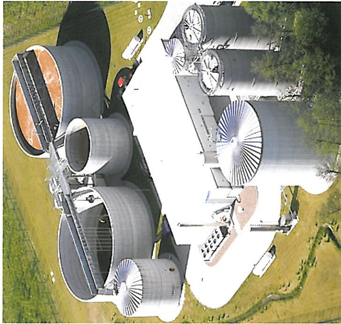
Prozesswasseraufbereitung für die August Storck KG